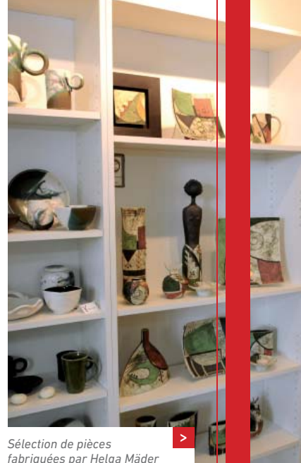
Sélection de pièces fabriquées par Helga Mäder

« Eh oui, j'aime bien finalement ma petite vie à la campagne ! ».