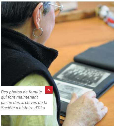
Des photos de famille qui font maintenant partie des archives de la Société d'histoire d'Oka